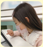
プログラミング教育 HALLO 本校校 EKちゃん (小学3年) のご両親

小学2年生から HALLO をスタート。小学校生活に慣れたこの学年でプログラミングを習い始めてよかったです。本や活字が大好きで、国語力はもともとあったと思いますが、HALLO の学習で試行錯誤することを覚え、算数の力も伸びてきました。初めは難しいステージでコーチへ質問することも多かったですが、Python のブロックモードに入ってから、順調に進めていて、人に聞く前に、ある程度自分で考えて解決しようとする姿勢が見えてきました。タイムアタックなど、制限時間内で対処することは苦手なタイプだと思うので、今後の HALLO での学びで、時間管理や問題解決力を身につけて欲しいです。